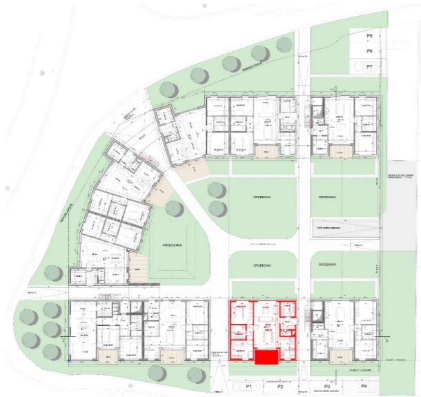
Grondplan niveau 0 Appartement 0.3